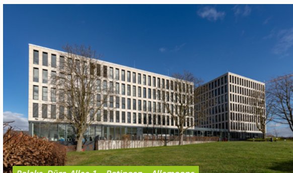
Balcke-Dürr-Allee 1 - Ratingen - Allemagne

La résilience du patrimoine d'Opus Real et l'appréciation de son portefeuille permettent l'augmentation du prix de souscription au 1 er avril. Par ailleurs, la SCPI a anticipé l'échéance de son crédit court terme en le refinançant au 1 er avril avec une marge compétitive autour de 1 % sur 5 ans et permettant des investissements en avance de phase de collecte. Plusieurs opportunités d'investissement sont en effet à l'étude sur des actifs de bureaux dans des villes secondaires dynamiques et attractives d'Allemagne.